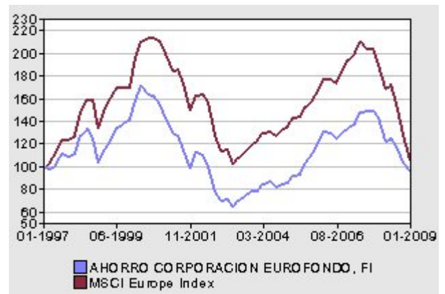
Rentabilidad acumulada del fondo contra su Índice