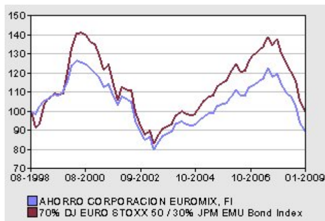
Rentabilidad acumulada del fondo contra su Índice