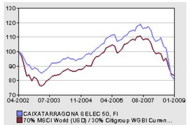
Rentabilidad acumulada del fondo contra su Índice