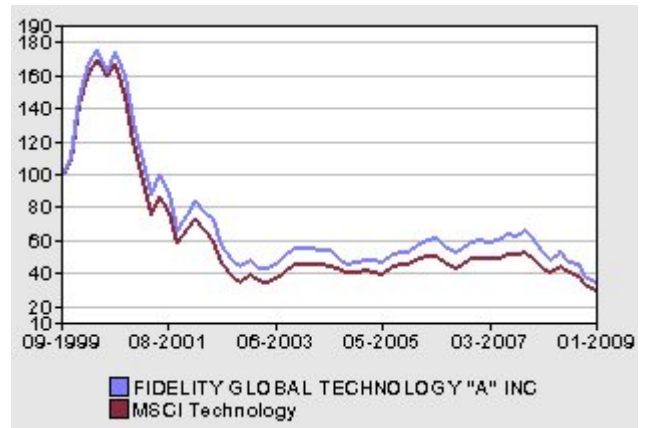
Rentabilidad acumulada del fondo contra su Índice