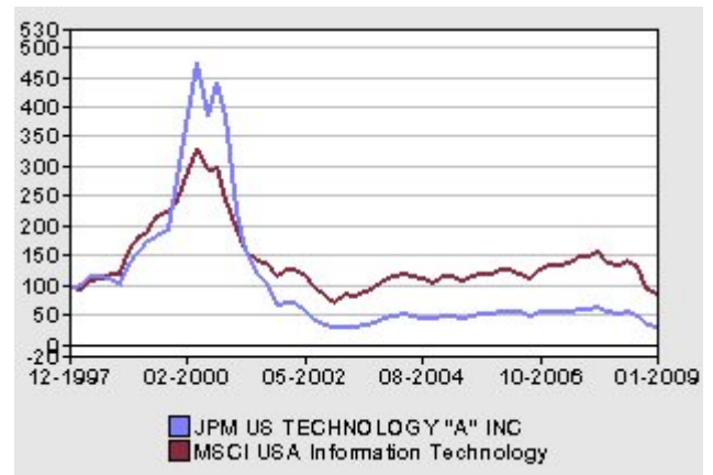
Rentabilidad acumulada del fondo contra su Índice